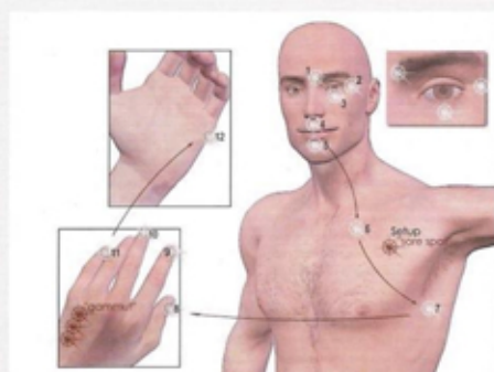
Figuur 1 De kloppunten die gebruikt worden bij EFT

Grondgedachte achter EFT is dat alle negatieve emoties veroorzaakt worden door een verstoring van het energiesysteem. Let wel: het is niet de oorsprong van de negatieve emoties, die ligt in de gebeurtenis of het trauma dat is voorgelopen. De reden dat de cliënt last blijft houden van de negatieve emoties komt omdat er een koppeling blijft bestaan tussen de gebeurtenis van vroeger en deze bijbehorende negatieve emotionele reactie, zolang deze verstoring niet is opgeheven. Als iemand een fobie voor muizen heeft dan zal het zien van (of denken aan) een muis een angstreactie oproepen (hartkloppingen, schreeuwen, op een stoel springen). Dit komt op zich niet door dit kleine muisje (het is immers geen levensbedreigende situatie) maar doordat alle nare ervaringen met muizen die deze persoon heeft meegemaakt (van een eng tekenfilmje zien als kind, tot geschrokken zijn van een dode muis, en gepilaagd zijn met muizen, vast zijn blijven zitten in het energiesysteem. Zo kan het dus gebeuren dat een relatief kleine gebeurtenis nu (je ziet een muis), een reactivering kan veroorzaken van een emotie die veel groter is dan je op grond van de daadwerkelijke inhoud van de gebeurtenis zou verwachten.